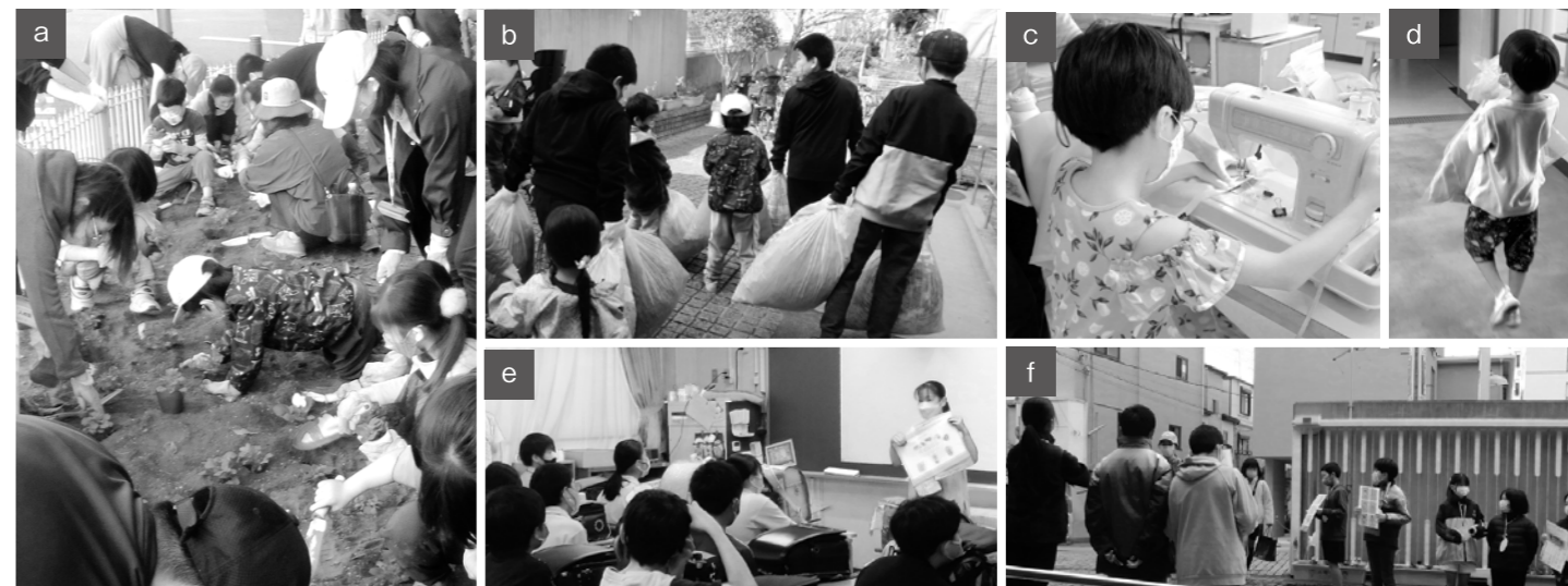
a. 11月のガーデニング(サポーター活動)の様。教頭先生も含めて大人10名・子ども20名が参加してくれました。活動前に学校周辺の落ち葉を清掃していると、公園で遊んでいた子どもたちが手伝いに集まってくれ、そのまま苗植えも一緒に。 b. 大人15名・子ども12名が参加してくれた12月の落ち葉清掃(サポーター活動)。学校南側を中心に、わずか30分でゴミ袋10個の落ち葉を集めました。それでもこの

『鶴の恩返し』の鶴のように人知れず「子どもたちの学校生活のために保護者(P)と先生(T)ができること」を続けるのももちろん大切なことですが、ときに子どもたちと一緒に活動できると、「やってよかったな」もひとしおですね。