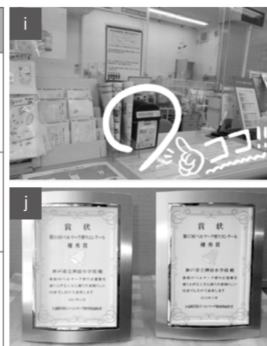
g. 2021年度から導入した、作業の細分化。「切る」に加えて「分ける」「(できる範囲で)数える」、そして回収ボックスに入れていただくことを各家庭にお願いしています。 h. ウェブベルマーク(楽天などでのお買い目の前の「ちょい寄り」で加算)への協力もありがとうございます。稗田小は灘区1位(11月時点)だそう。 i. あらたに、水道筋郵便局の窓口カウンターにもベルマーク回収ボックスを設置させていただきました。学校(玄関ホール)、マルハチ(1Fサービスカウンター)、郵便局、どこかの回収ボックスに入れていただいても大丈夫です。 j. 2021年度年から2年連続で「ベルマーク便利コンクール」(公益財団法人ベルマーク教育助成財団)の「優秀賞」を受賞。副賞として3万円をいただきました。