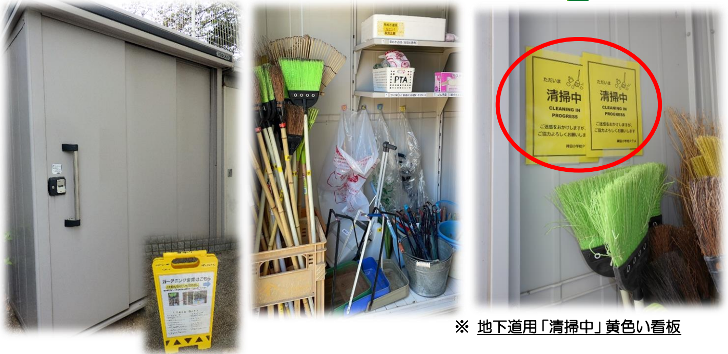
※ 地下道用「清掃中」黄色い看板

★清掃道具には清掃場所が明記してありますので、担当する場所のものをお使い下さい。 (必要なら、清掃場所が明記されていない清掃道具も使って頂いて構いません)