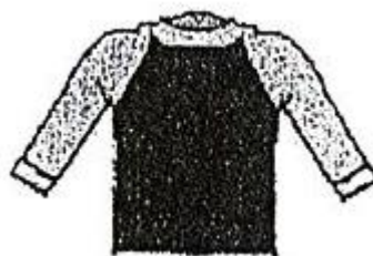
男女兼用ラッシュガード ・ 女子用ラッシュガード兼トップ